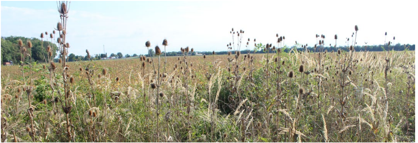
Über den Winter stehenbleibende Blühflächen als ungestörter Lebensraum und Nahrungsquelle