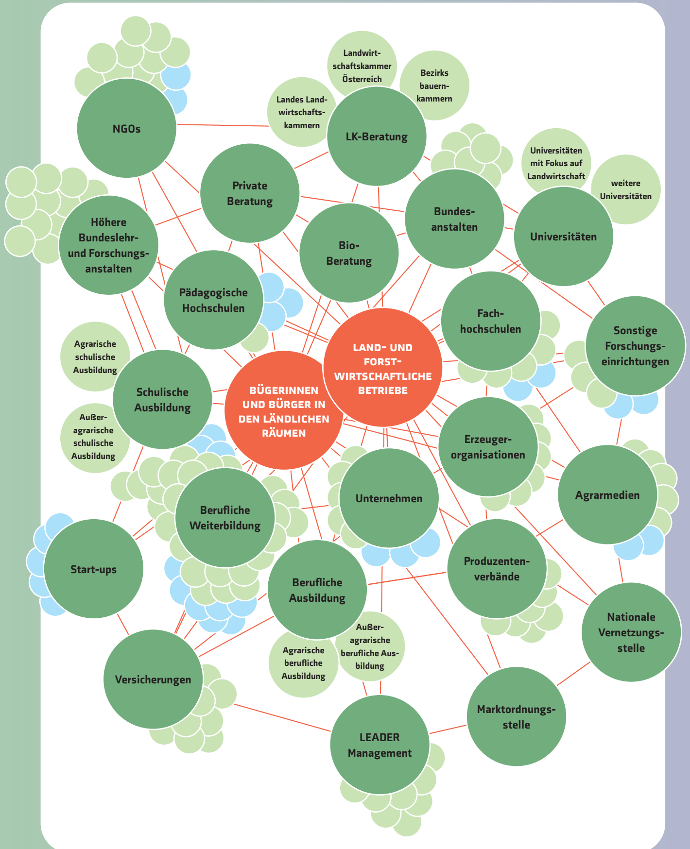
ABBILDUNG 2 AKIS IN ÖSTERREICH IN DER FÖRDERPERIODE 2023–27